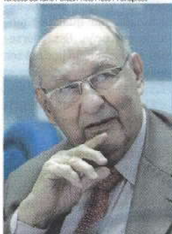
Ives Gandra: ao interferir nas funções do Legislativo e do Executivo, o Judiciário rompeu o equilíbrio democrático