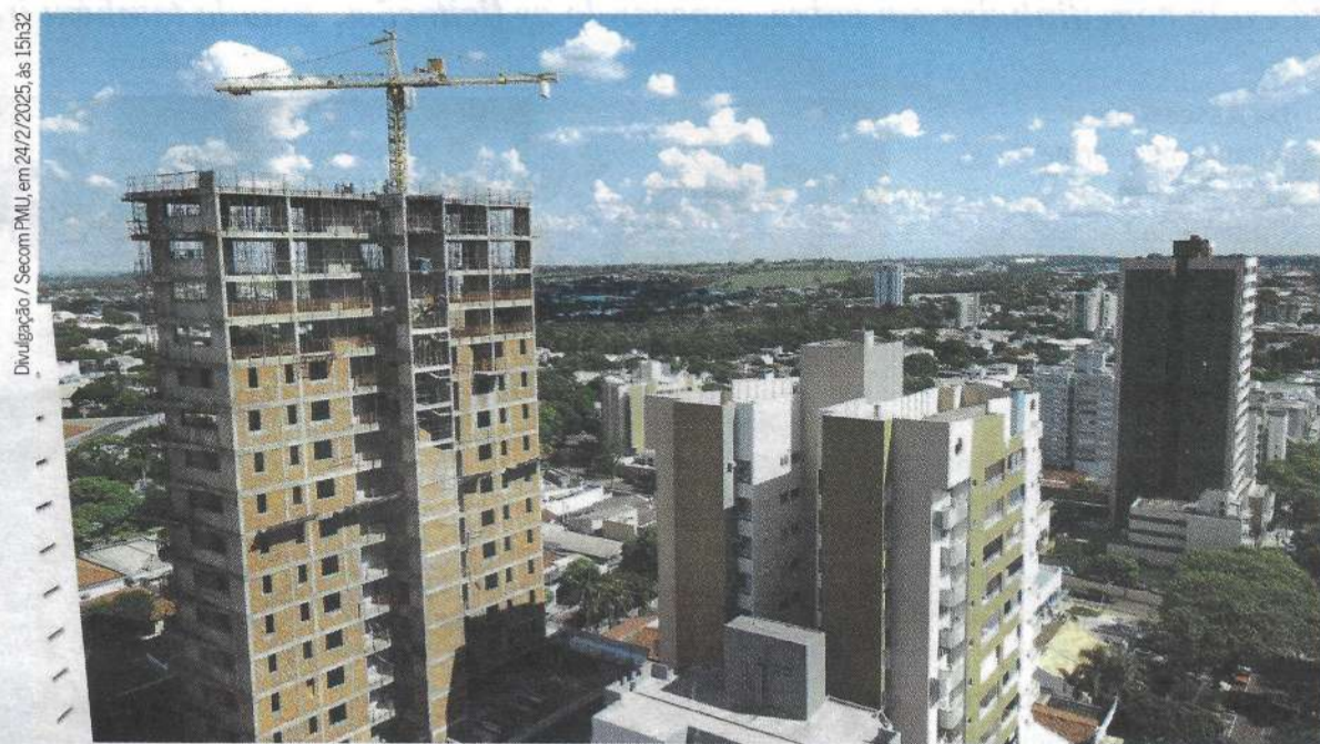
Autorização de projetos voltados à construção civil apresenta aumento de 24,82% em 2025

No comparativo com 2024, o crescimento na aprovação de projetos foi de 24,82%. A diferença é ainda maior se comparados os desempenhos de 2025 e 2023 — aumento de 33,1%. “Recebemos gran-