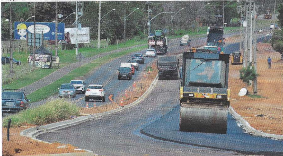
Trecho urbano da PR-580 dá lugar à avenida Pedromiro e está sendo duplicado: importante conquista para Umuarama e Região Metropolitana

em 21/8/2025 às 14h13