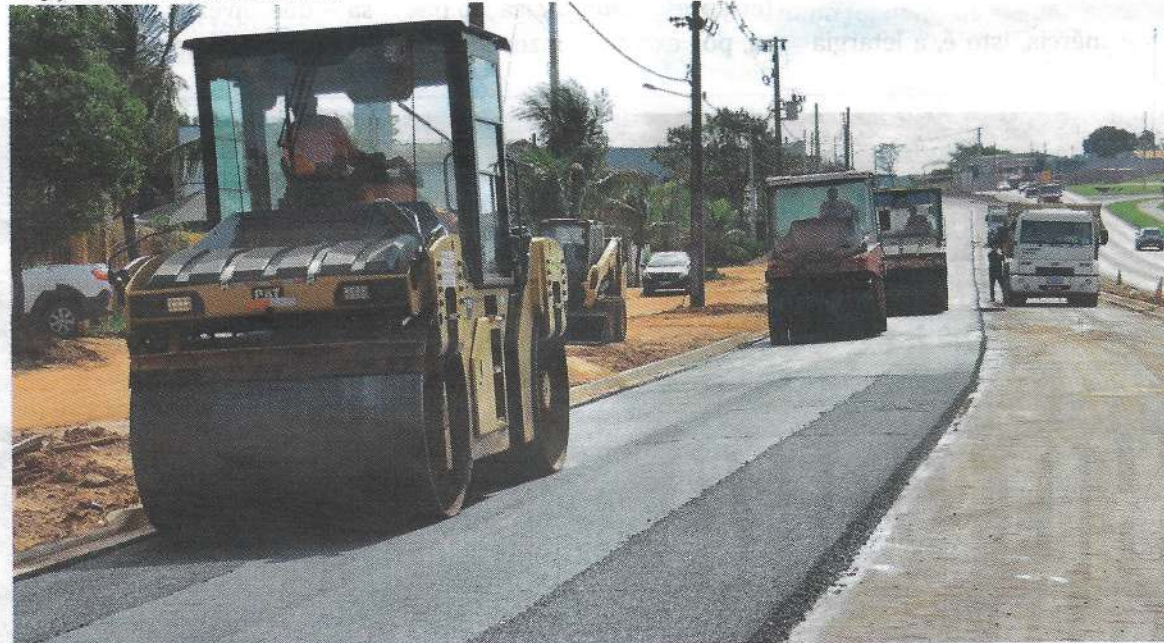
Prefeitura coloca recursos próprios para melhorar a vida dos moradores do Jaboticabeiras, Ibirapuera, Primeiro de Maio e a vizinhança do pátio rodoviário, região Norte da cidade

em 21/8/2025 às 14h19