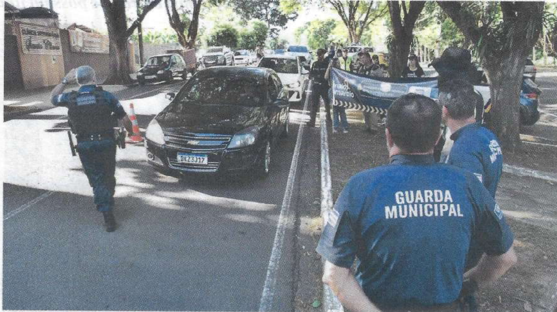
Ação educativa alerta os motoristas dos perigos que são o excesso de velocidade e o uso do celular

em 14/5/2025 às 15h40