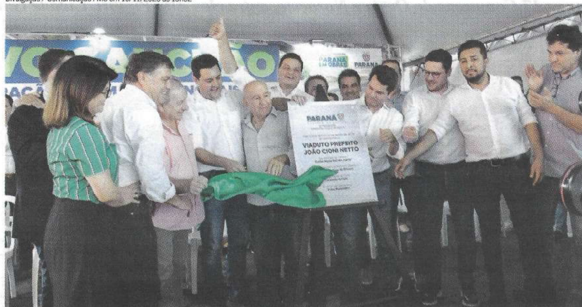
Inauguração da duplicação da PR-323, em 10 de novembro de 2023, momento histórico para Umuarama e Região Metropolitana. Agora corredor do desenvolvimento será iluminado.

Divulgação / Comunicação PMU em 10/11/2023 às 15h52