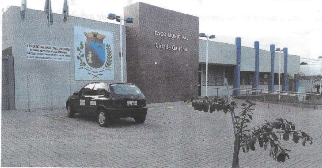
115 Municípios do Paraná correm risco de perder recursos do Fundeb em 2026. Entre eles, Cidade Gaúcha, na Região Metropolitana de Umarama.

Anderson Spagnolo / Coluna em 6/7/2020 às 17h39