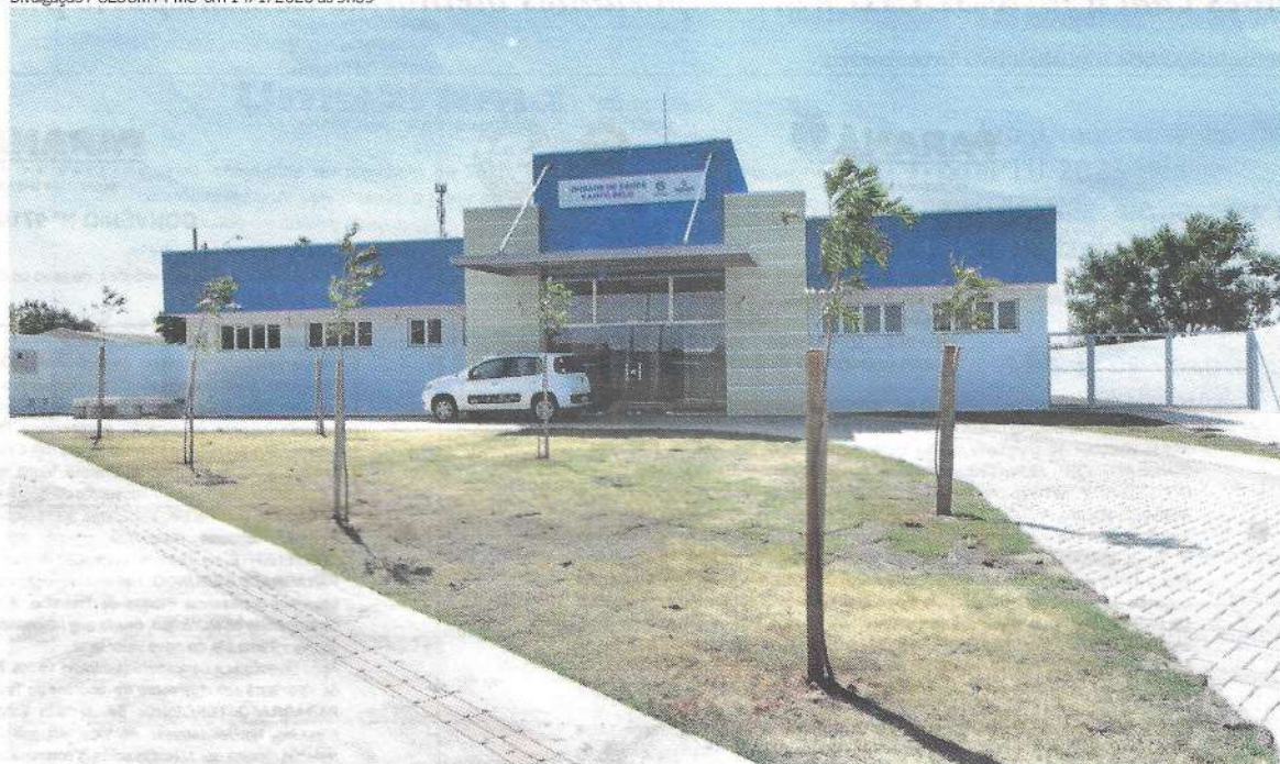
Com a UBS Campo Belo Umuarama chega a 19 postos de saúde na área urbana

Divulgação / SECOM / PMU em 14/1/2025 às 9h39