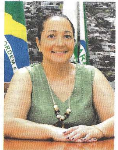
Andreia Guimarães: IPTU 25 apresenta correção de 4,87%, mas quitado à vista Prefeitura dá 6% de desconto

Divulgação / SECOM / PMJ em 22/1/2025 às 9h24